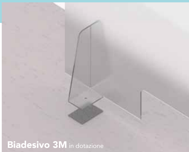
Biadesivo 3M in dotazione