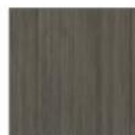
T60 EUCALIPTO EUCALYPTUS