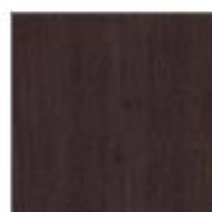
T42 ROVERE SCURO DARK OAK CHENE NOIR