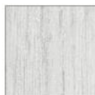
T48 BIANCO VENATO VEINED WHITE BLANC VEINE