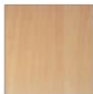
T07 FAGGIO BEECH HETRE