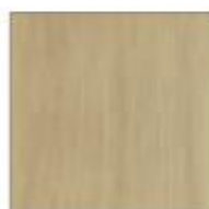
T32 ROVERE CHIARO LIGHT OAK CHENE CLAIR