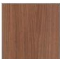
T40 NOCE CANALETTO WALNUT NOYER