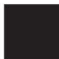
T09 NERO BLACK NOIR